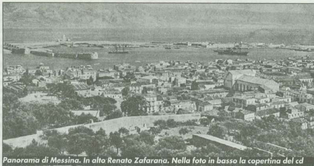
Panorama di Messina. In alto Renato Zafarana. Nella foto in basso la copertina del cd